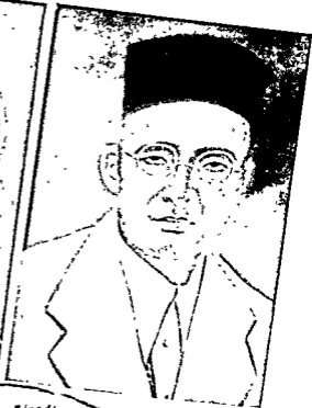
अशफ़ुल्ला ख़ान कामी 19 दिगम्बर, 1927